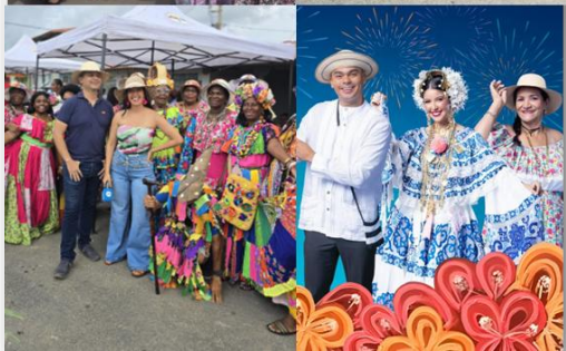
Imagen con fin ilustrativo